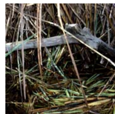
Restes de repas

On peut également retrouver des nids aménagés dans une touffe de végétation de berge.